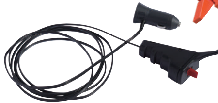
全旋回グラスパー ダイナ リモコン送信機セット