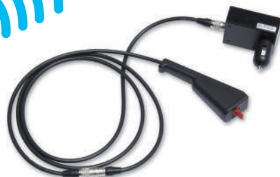
全回転グラスパー ダイナ リモコン送信機セット

GV-62SD GV-122SD GV-202SD ※写真は GV-62SD です。