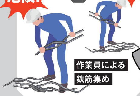
作業員による 鉄筋集め