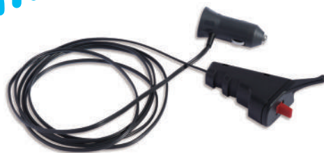
全旋回グラスパー ダイナ リモコン送信機セット

GV-62SD GV-122SD GV-202SD ※写真は GV-122SD です。