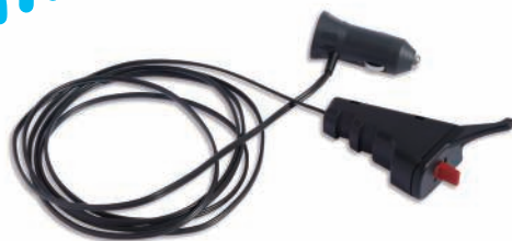
全旋回グラスパー ダイナ リモコン送信機セット

GV-62SD GV-122SD GV-202SD ※写真は GV-122SD です。